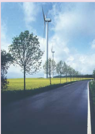
Windkraftanlage in einem Rapsfeld an einer Landstraße.

Warum auf Altbewährtes verzichten? Das wird sich mancher Hausbesitzer fragen, wenn es um den Einsatz erneuerbarer Energien geht. Viele gute Gründe sprechen dafür.